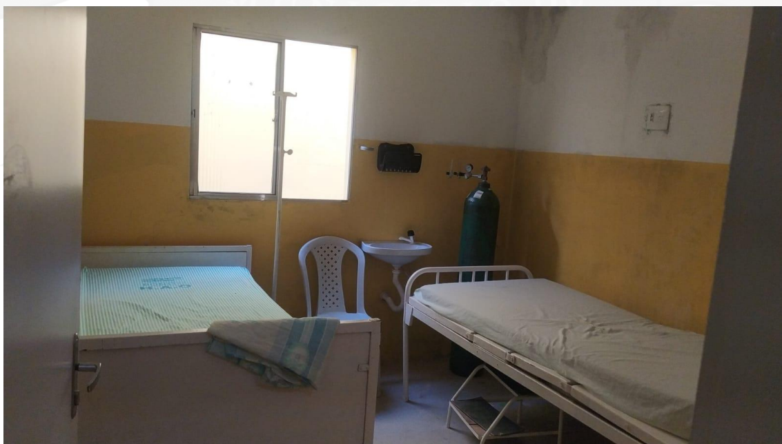
Sala de Observação