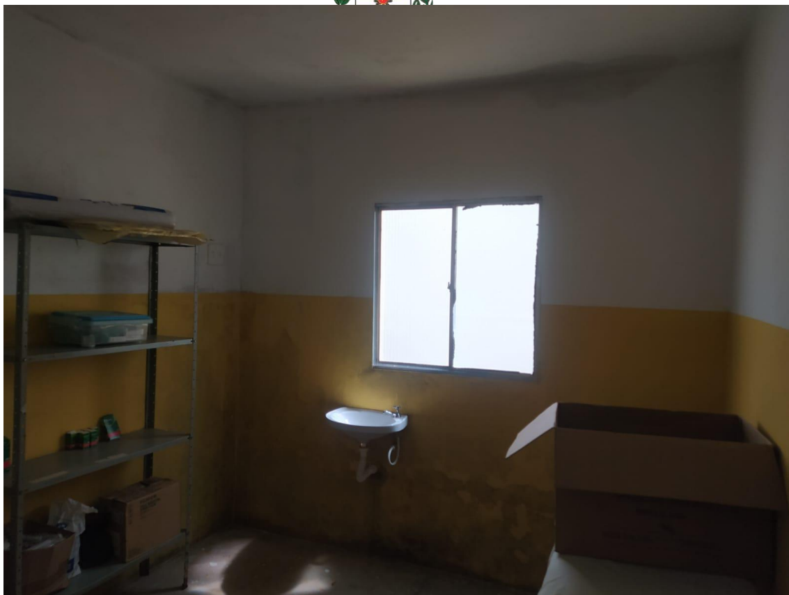
Sala de Distribuição de Medicação