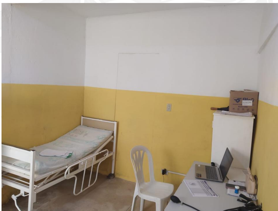
Sala de curativo