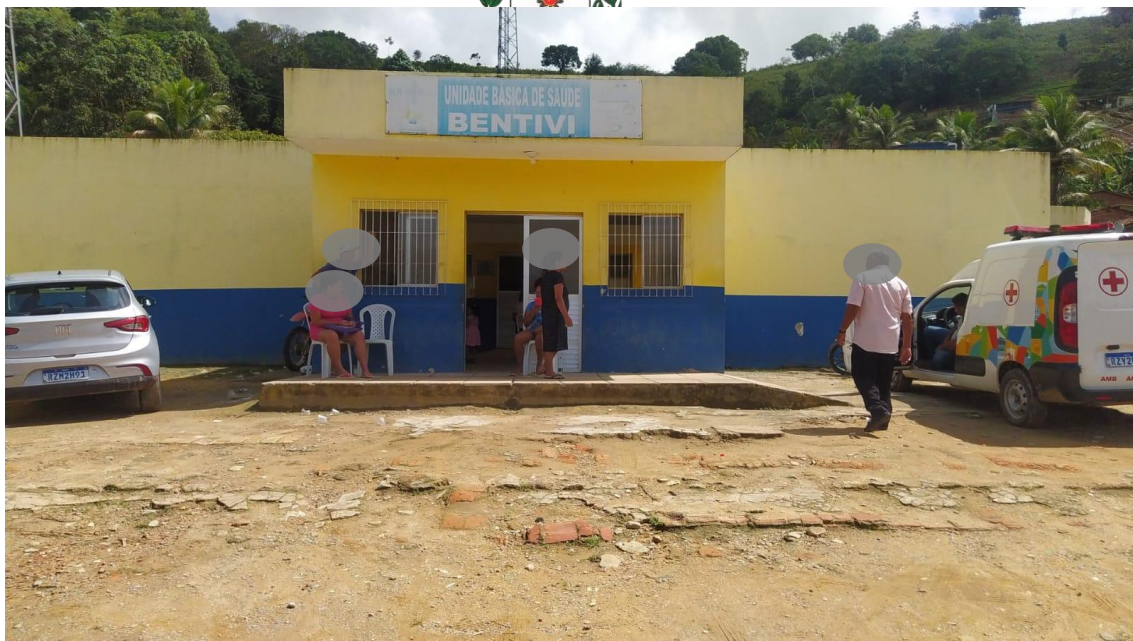
Frente da Unidade