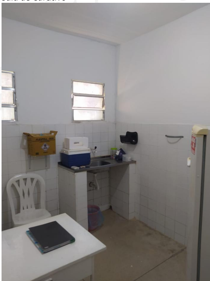
Sala de Vacinação