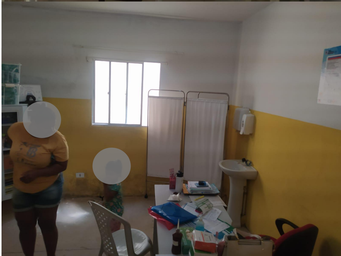
Consultório de Enfermagem