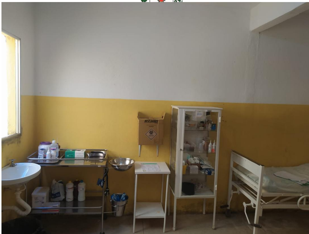
Sala de Curativo