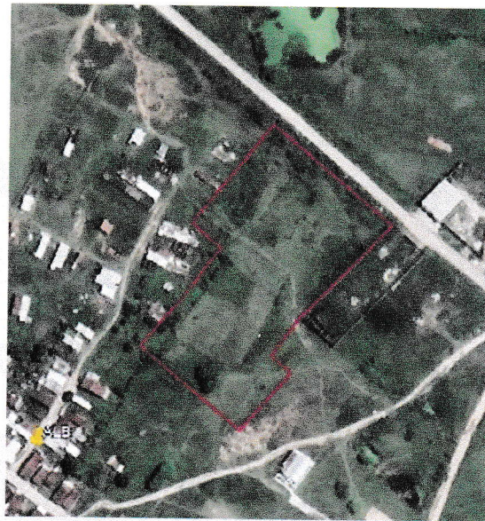
Figura 1: Imagem aérea do imóvel

PREFEITURA DO BONITO Mais Trabalho e Prosperidade